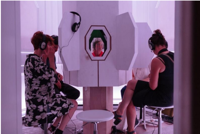
Zaostavština, komadi bez ljudi

Celinu od tri instalacije na 52. Bitefu zaokružuje rad Zaostavština, komadi bez ljudi poznatog reditelja Štefana Kegija, jednog od tri člana svetski proslavljenog kolektiva Rimini Protokol , a koji je produkcija jednog od vodećih švajcarskih pozorišta, Vidija iz Lozane. Trejler predstave pogledajte OVDE .