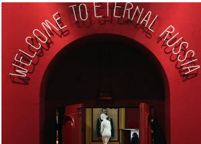
Večna Rusija, foto: Dorothea Tuch

Višeslojni kuratorski koncept ovogodišnji Bitez vodi u više pravaca. Jedan od segmenata festivala čije se dve od tri produkcije direktno bave fenomenom smrti, otkriva, međutim, još jedno značenje slogana. Radi se o pozorišnim instalacijama, predstavama bez živih glumaca na sceni.